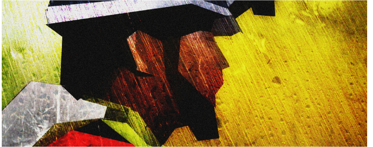
Verftssaken: Norsk høyesterett tok ikke hensyn til anbefalingene fra EFTA-domstolen.