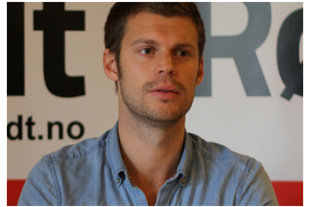
Krever gransking: Rødt-leder Bjørnar Moxnes.

– Det er sannsynleggjort at Eidsiva heile tida har vore ute etter Kallerudlia 9 for lokalisering av forbrenningsanlegget. For å få denne tomta har det vore gjort ei manipulering der både aktørar frå Eidsiva og Gjøvik kommune har vore involverte. Slik aktivitet kan berre beskrivast som politisk korrupsjon.