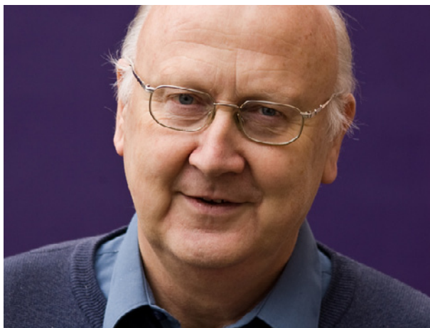
Gruppeleiar: Torstein Dahle.