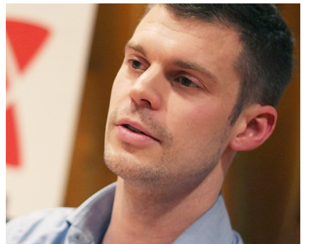
Rødt-leder: Bjørnar Moxnes.

– Nye direktiver står i kø. Både Jernbanepakke 4 og Håndhevingsdirektivet vil utfordre norske regelverk. Beholder vi EØS-avtalen blir det fort mange nye saker som denne. At det gikk bra denne gangen betyr ikke at det trenger å gjøre det i neste