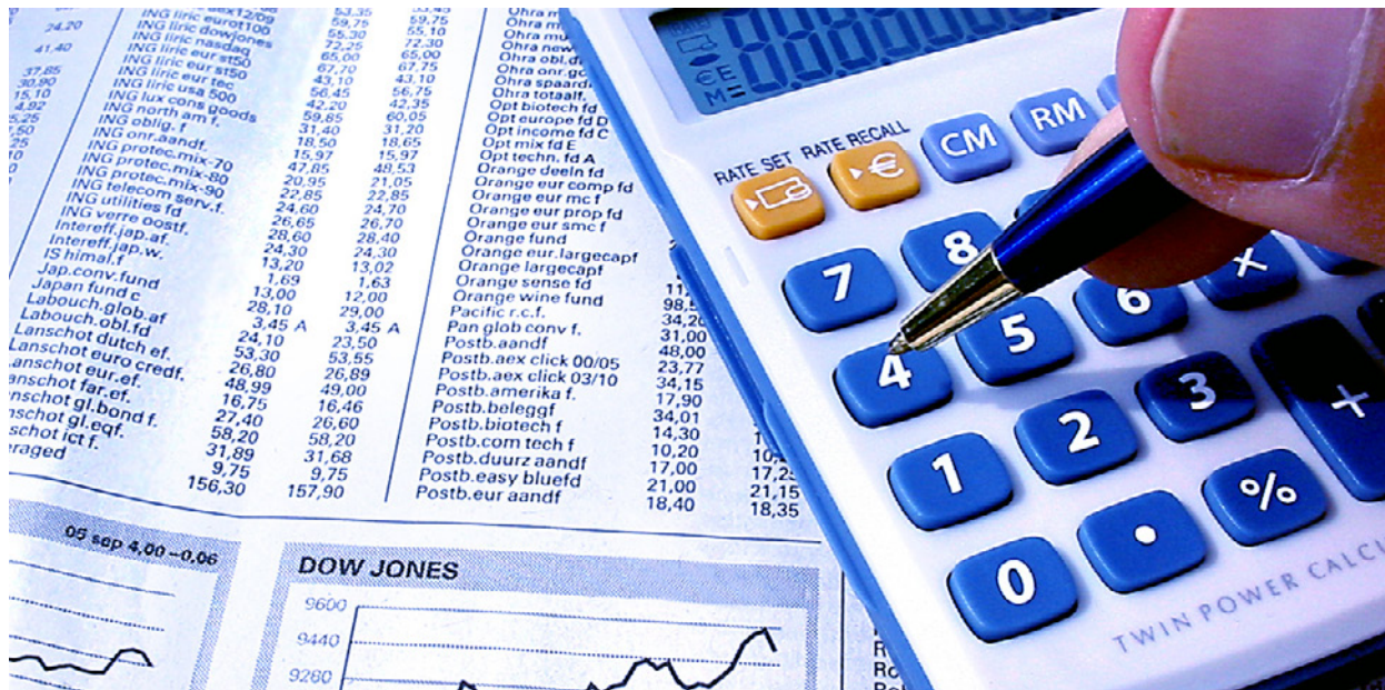
Spekulasjon: Raudt vil skattlegge finansspekulasjon hardarde.