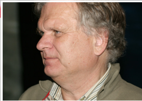
Rådgiver: Stein Stugu.

LO krevde også at norske avtale- og lønnsforhold skulle gjelde for arbeid i Norge, og at vertslandets regler må gjelde som minimum for arbeid i andre